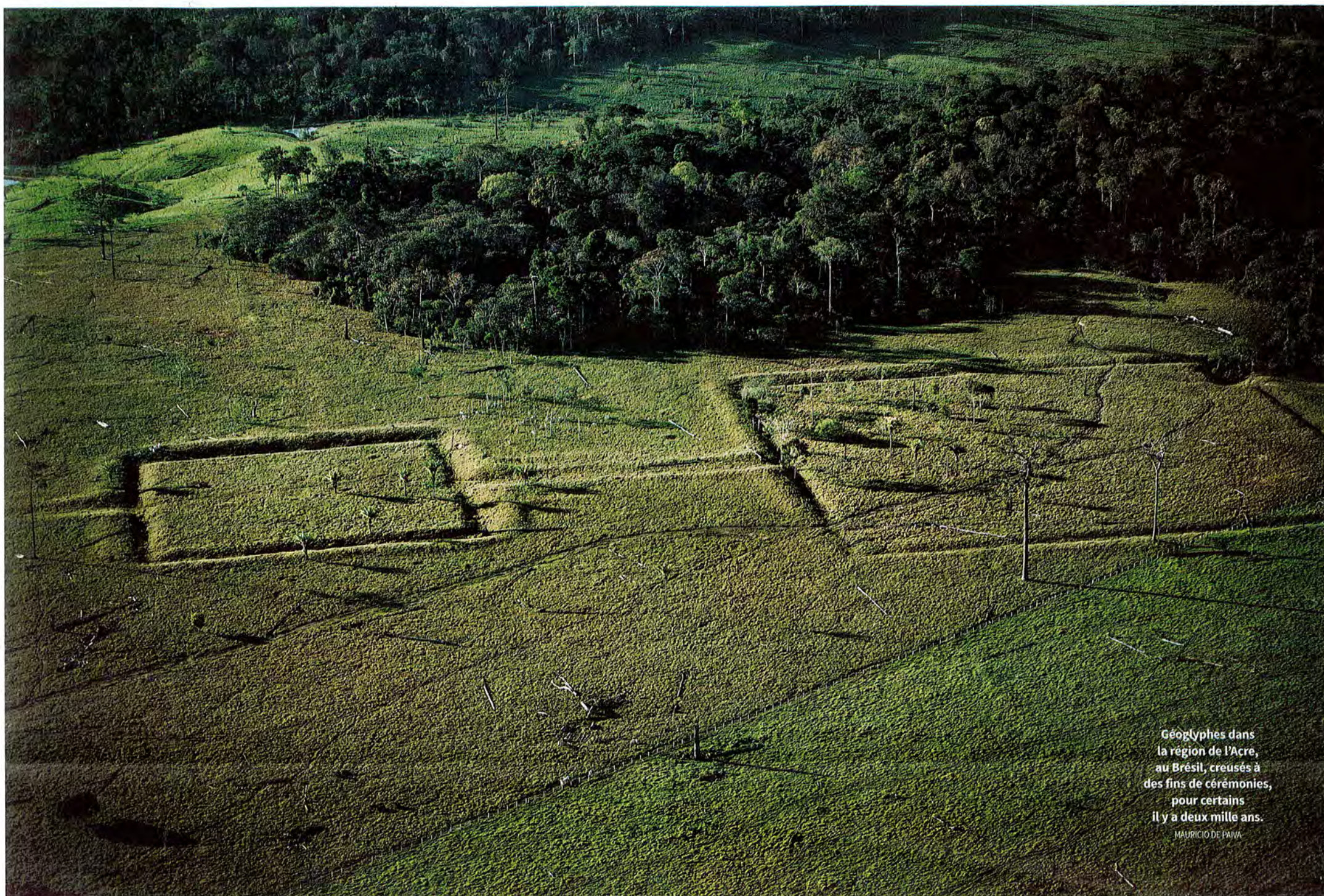
Géoglyphes dans la région de l'Acre, au Brésil, creusés à des fins de cérémonies, pour certains il y a deux mille ans. MAURICIO DE PAIVA