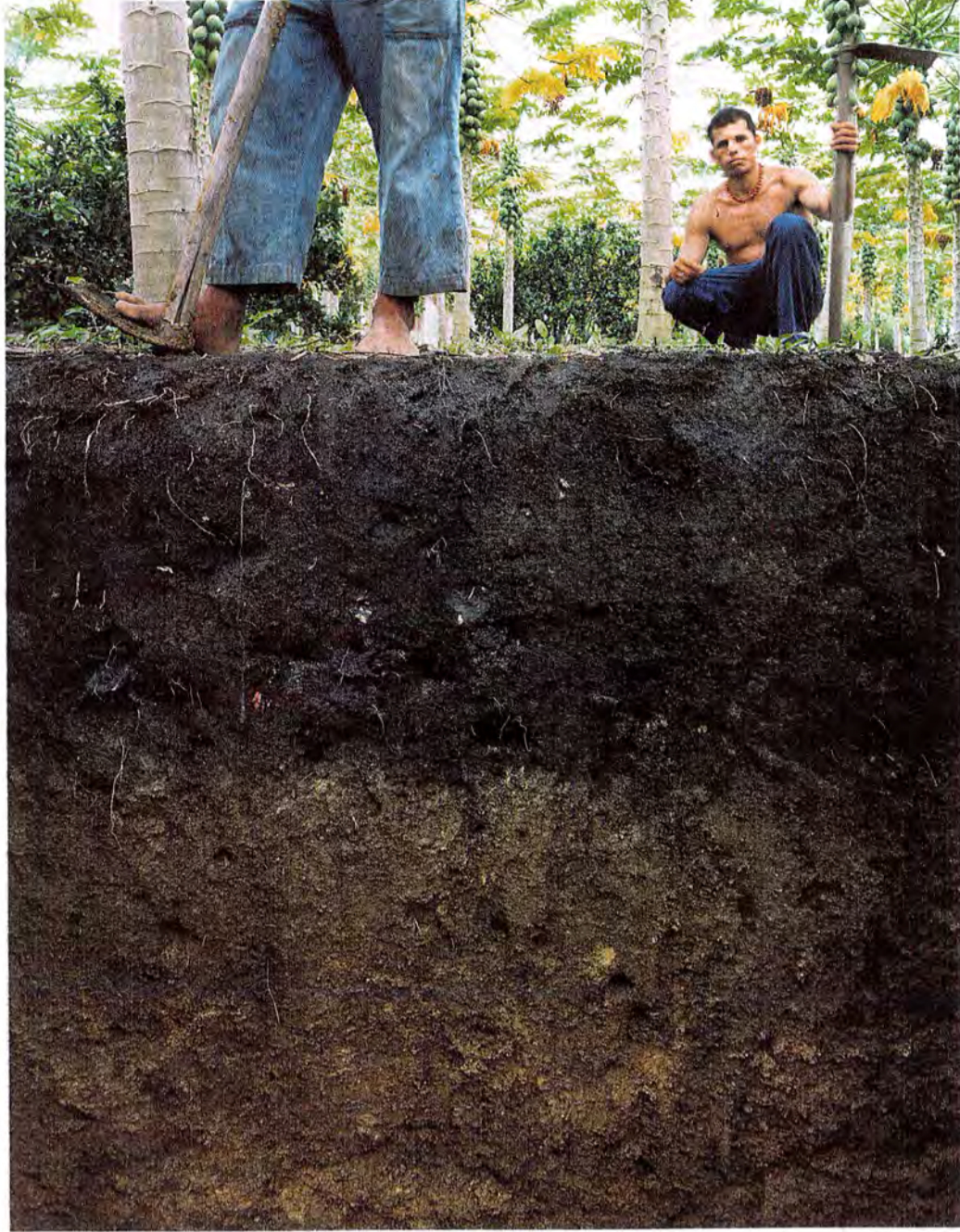
Ci-contre, « Terra preta », sol artificiel fertile résultant de l'activité des Amérindiens, près de Manaus (Brésil).