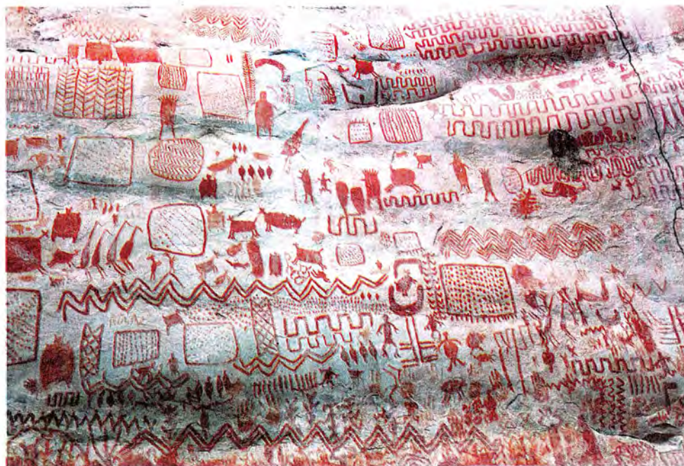
Peinture rupestre, dont certaines ont plus de 12 000 ans, Serranía de La Lindosa, en Colombie.