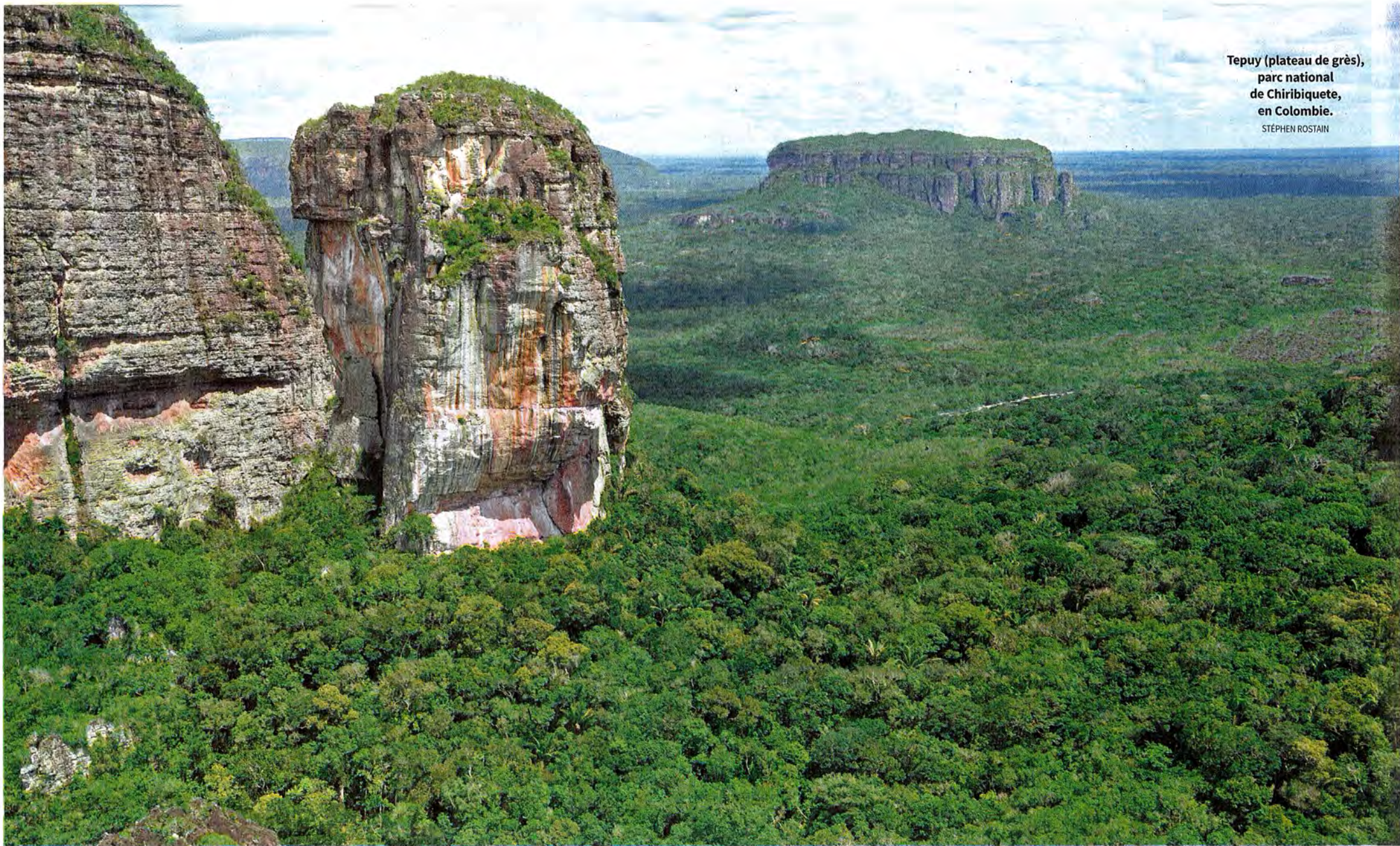
Tepuy (plateau de grès), parc national de Chiribiquete, en Colombie. STÉPHEN ROSTAIN