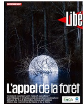
Encarté national Libération

Un cahier spécial intégré à l'édition nationale du 7 décembre, tiré à part à 1000 exemplaires et distribué aux participants durant le Festival ;