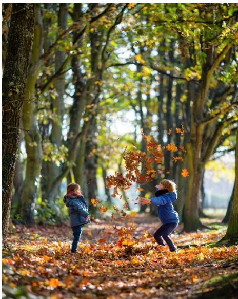
Concours photo - Prix Spécial du Jury

Dans une logique progressive, les sujets ont permis de comprendre ce que sont les arbres, ce que l'homme en fait, comment gérer les forêts et les espaces boisés sources de biodiversité, comment les arbres peuvent nous aider à gérer les crises, mais aussi comment l'humain peut intervenir pour les aider à s'adapter et pour mieux les gérer en ville, en forêt et dans les champs.